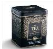
a tea tin