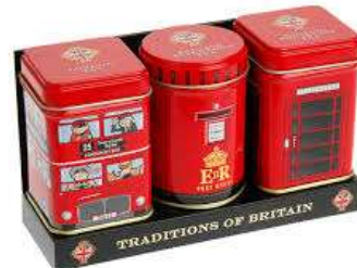
a pack of three mini tea tins called « traditions of Britain »